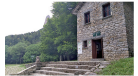
Pradera de Ordesa