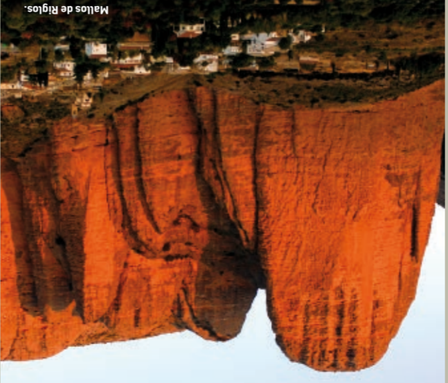
Mallos de Riglos

Der Berg, dem die Römer den Namen eines Menschen gab, der „mons Caus“, erhebt sich eisern über das Tal und breitet seinen übernatürlichen Einfluss auf die Umgebung aus. Diesen Zauber kann man auf Schritt und Tritt fast schon fühlen und atmen. Dort romanische Dichter inspiriert haben, verzauberte Burgen, die in einer Nacht gebaut wurden, Legenden von Hexen und unvergessenen Wappenschildern, und Städte von altem Adel, die Schmuckstücke aus der Mudéjar-Zeit bergen.