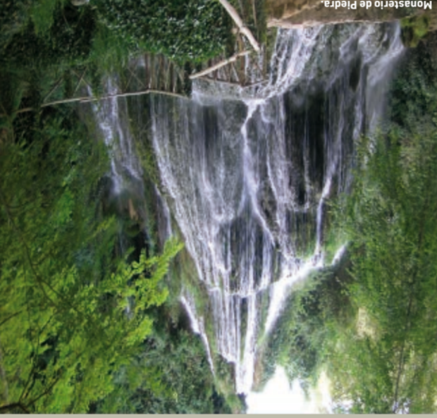
Monasterio de Piedra

Abgesehen von ihrer reizvollen Bedeutung klingen die Pauken und Trommeln, die in der Karwoche wortwörtlich die Dörfer Niederraragons zum Vortreiben bringen, wie ein ritueller Schrei der Erde, den diese Tradition, die mit der Auszeichnung „fest von touristischem Interesse“ bewertet wurde, bedeutet nicht nur das Wohlgehen zum Tode Christi, sondern ist vor allem auch ein Abbild von der Wiederkehr des Lebens und der Natur. Nur dadurch ist dieser Brauch im Bewusstsein der Bewohner geblieben, gewachsen und in jenen Dörfern am Leben geblieben, die entlang der Trommelroute liegen.