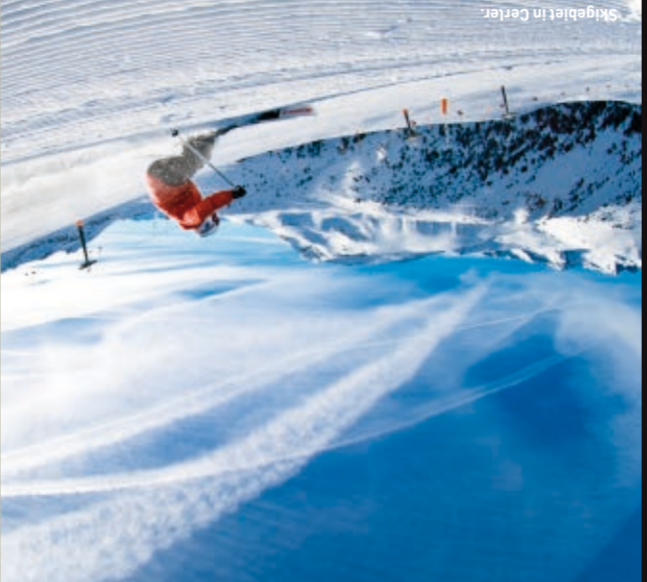
Sigüesta in Berastiz