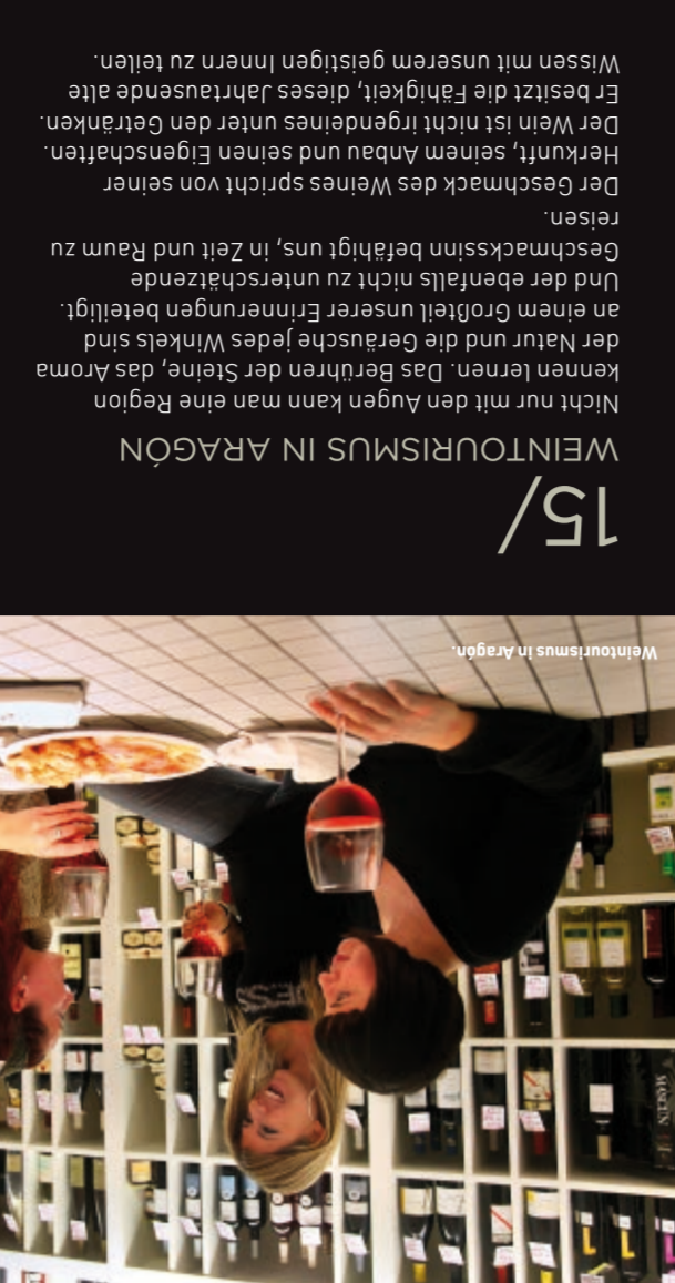
Weintourismus in Aragón

Der Reiz des Klosters am Fluss Piedra liegt in seiner traumhaften Umgebung, ein Paradies, das mehr als die Feder eines romantischen Dichters als von der Natur selber zu stammen scheint.