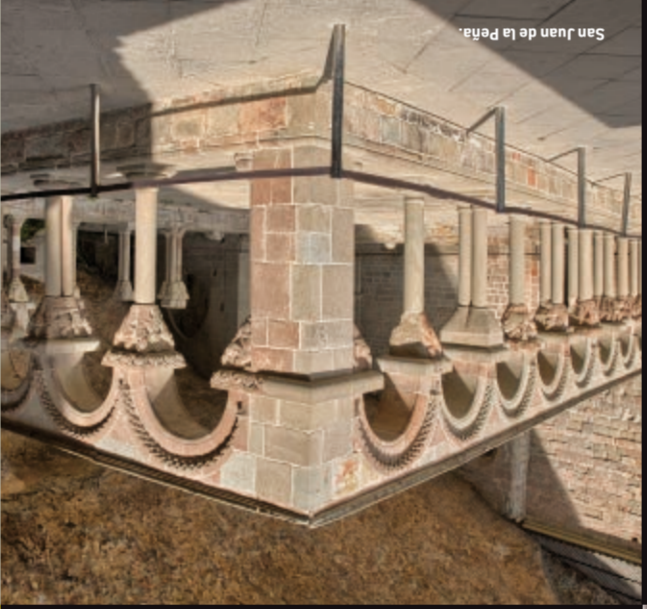
San Juan de la Peña

Der Berg, dem die Römer den Namen eines Menschen gab, der „mons Caus“, erhebt sich eisern über das Tal und breitet seinen übernatürlichen Einfluss auf die Umgebung aus. Diesen Zauber kann man auf Schritt und Tritt fast schon fühlen und atmen. Dort romanische Dichter inspiriert haben, verzauberte Burgen, die in einer Nacht gebaut wurden, Legenden von Hexen und unvergessenen Wappenschildern, und Städte von altem Adel, die Schmuckstücke aus der Mudéjar-Zeit bergen.